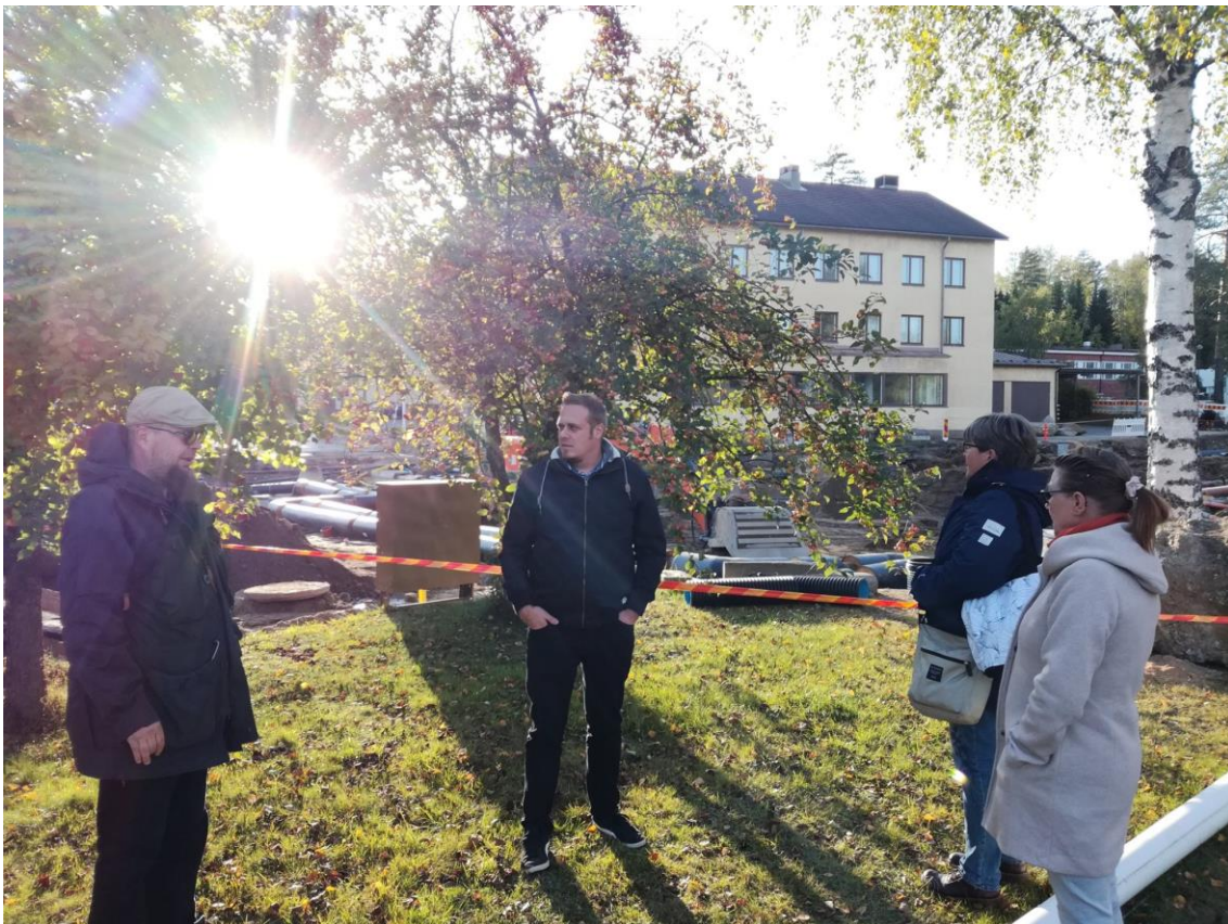
Tarkastuslautakunta tutustumassa Kummunkatu-Digiväylä-projektin etenemiseen 25.9.2019.