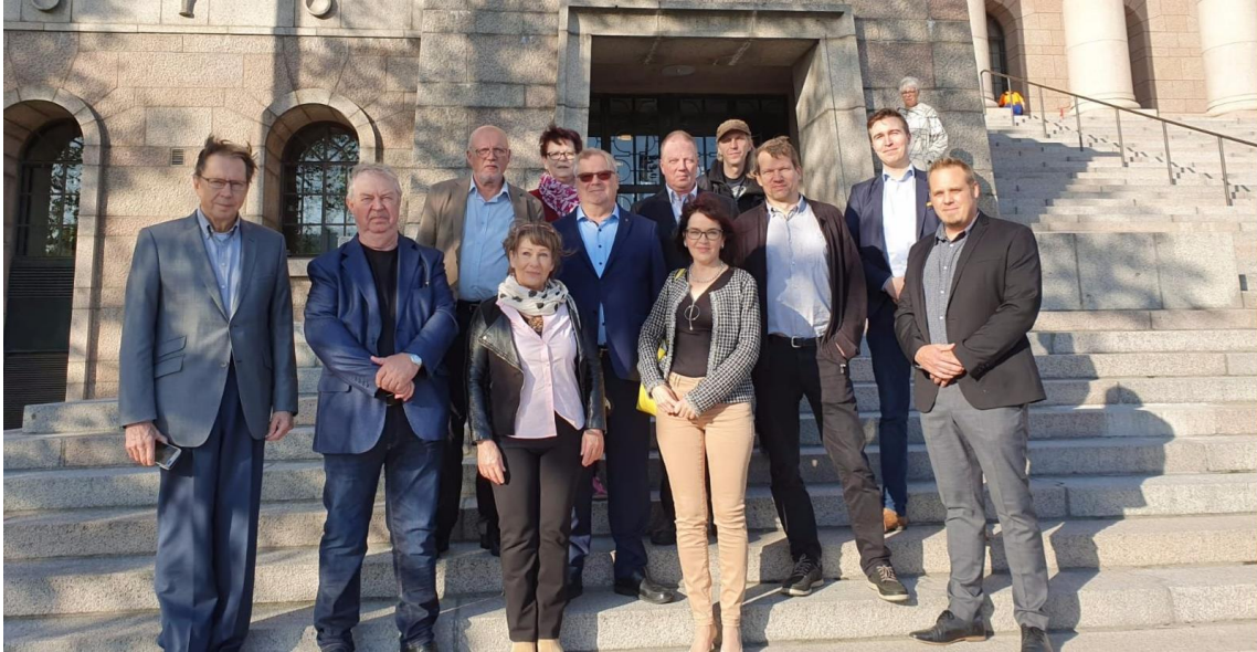
Kaupunginhallitus ja johtavia viranhaltijoita vierailulla Kuntamarkkinoilla sekä Eduskuntatalolla 11.9.2019.