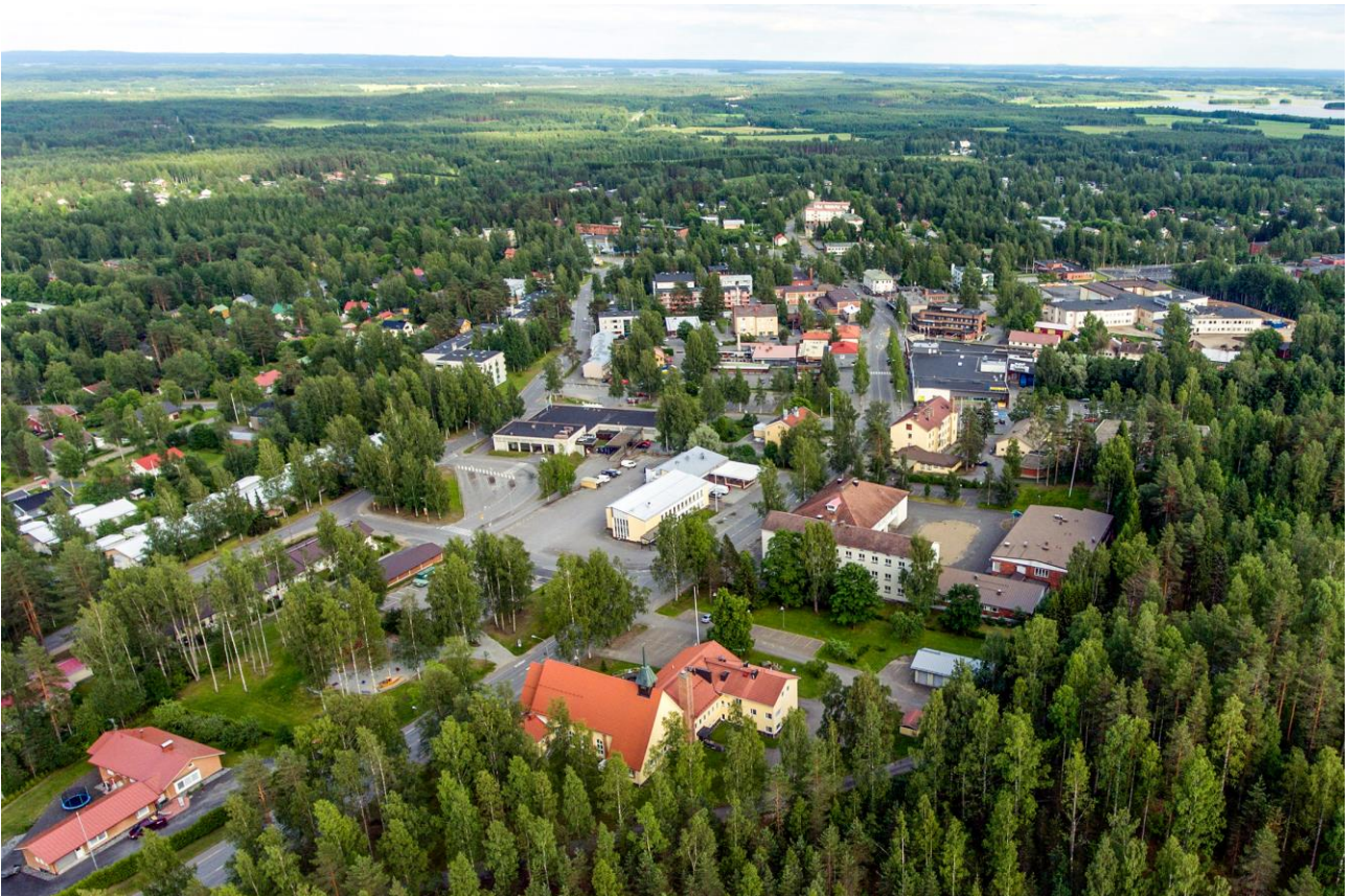
Kaupungin keskusta kaivoksen suunnasta kuvattuna. Etualalla Outokummun kirkko.

Tarkastuslautakunnan näkemyksen mukaan kaupunginhallituksen sekä elinvoima- ja omistajaohjausjaoston tulee päättää, miten yhtiön toiminta jatkuu.