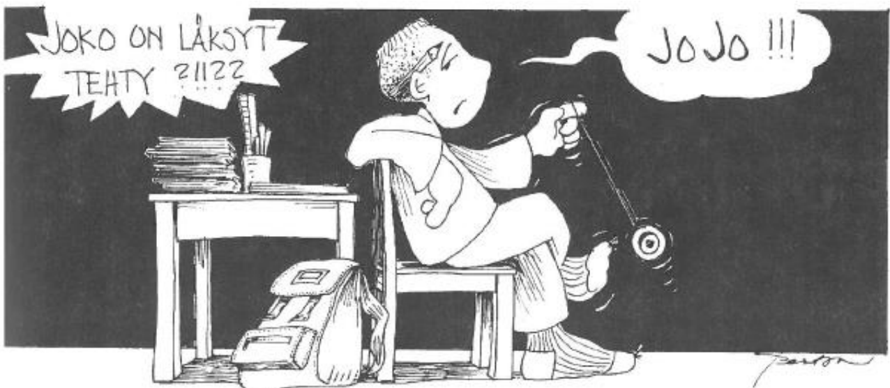
(Piirroskuvat: Pertsan III, kooste Pertti Hakasen asia- ja herjapiirroksista vuosilta 1990–1995 Outokummun Seudussa, viite 3.9.1991.)

Yhteistyö kolmannen sektorin kanssa on vaikuttavaa.